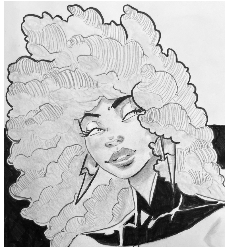
Obra de Joseph Richardson

T odos provenimos de diferentes ámbitos de la vida, con distintos orígenes, experiencias vividas y puntos de vista únicos que nos distinguen unos de otros. Todos transitamos por caminos diferentes, con una vocación en la vida. Lo que es adecuado para ti puede no serlo para otra persona, y eso está más que bien.