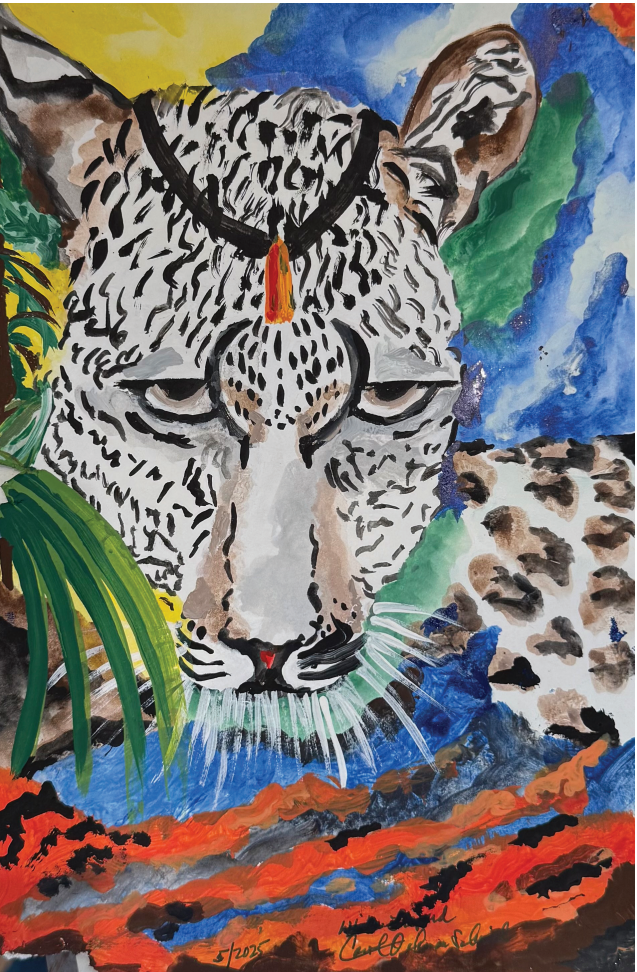
Pintura por Carol