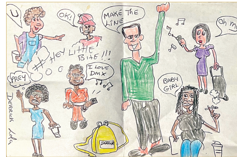
Cartoon by Lola and Derrick

Siento su amor en el sonido de los vientos Lo escucho en el canto de los pájaros Lo veo en los campos de flores Lo saboreo en la calidez de los amigos El amor de Dios siempre está cerca. Sin pedirlo, se derrama sobre mí. Ayer, hoy y muchos días por venir. Así es como Dios da su amor.