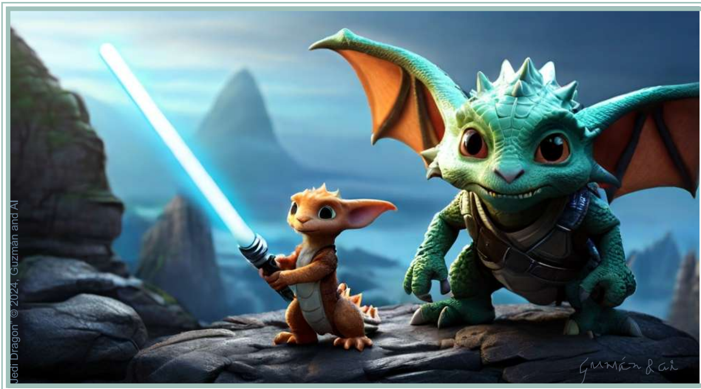
Digital cartoon by Dominic

No soy tú, nunca podrías ser yo, no soy el chico, tú podrías serlo alguna vez, pienso bien, piensas mal, deberías ser bueno, y lo necesitas, no soy tú, y sí Me preocupo, y cuando me necesites, estaré allí, no soy tú, nunca pierdas la esperanza, crees que eres gracioso, creo que eres un tonto.