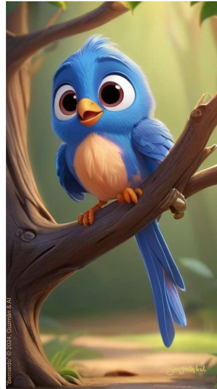
Digital art by Dominic

¡MI TONO ESTÁ ENTRE EL TODOPODEROSO Y YO! POR LO TANTO, ¿POR QUÉ DEBO SER TÍMIDO PARA DECIRTE POR QUÉ / MUCHO MEJOR QUE EL SALMÓN SOX EN EL OJO LOL