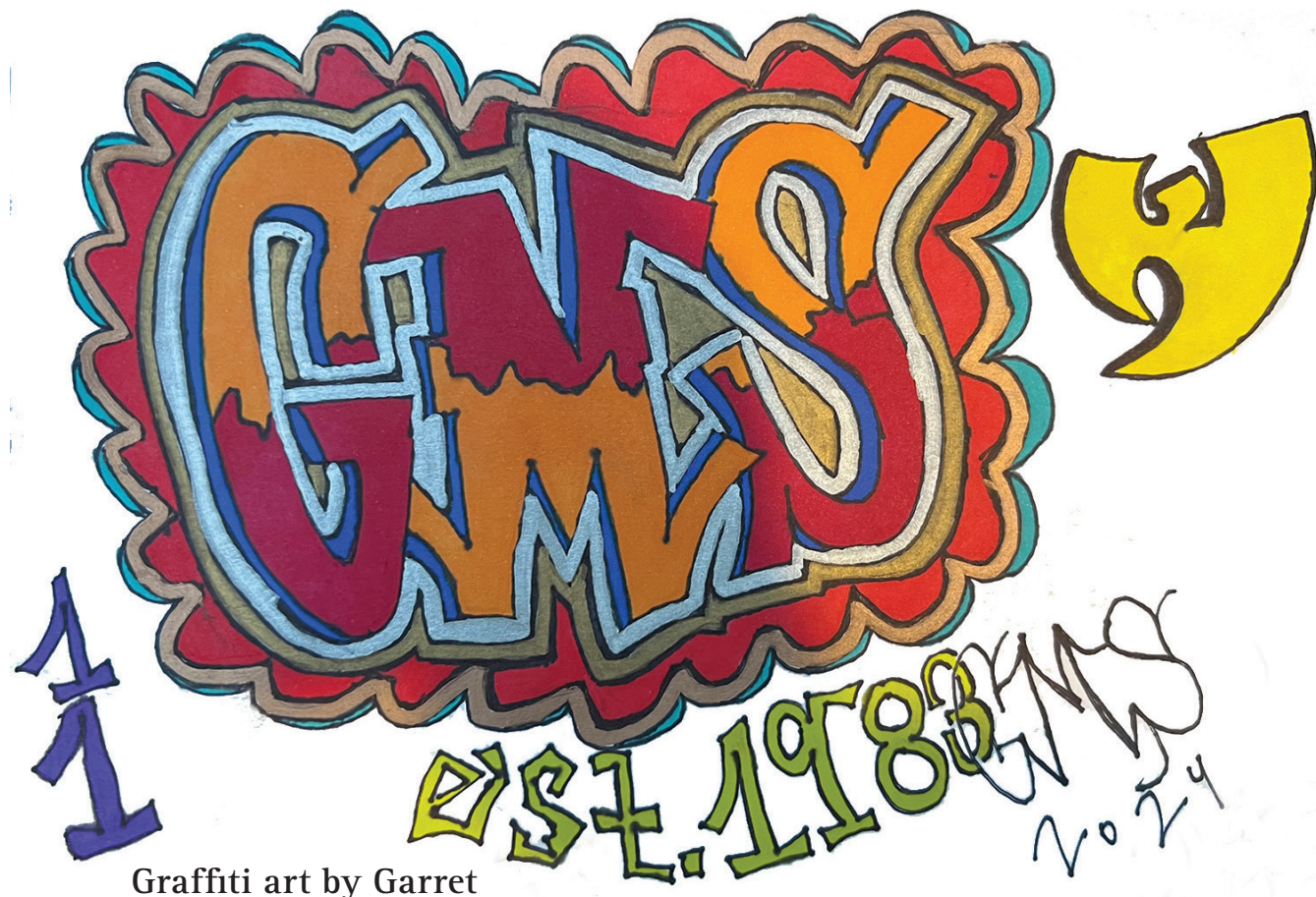
Graffiti art by Garret